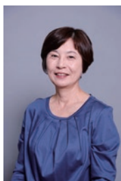
株式会社For SDGs 代表取締役